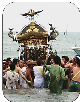
乱材祭/神輿海上渡御