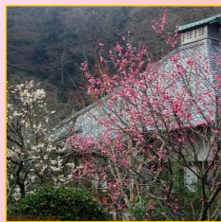
④ 梅の花に囲まれた 光則寺