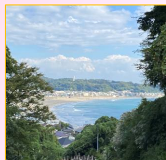
① 成就院参道から眺める 由比ヶ浜