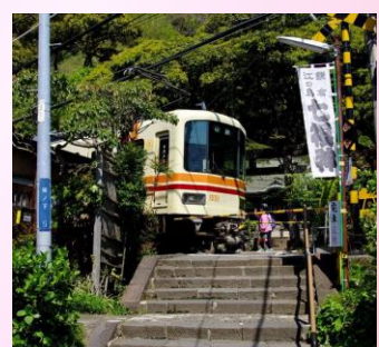
③ 御霊神社前の 江ノ電踏切