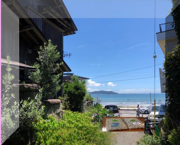
(地図(A)ビューポイント：路地から見える由比ヶ浜海岸